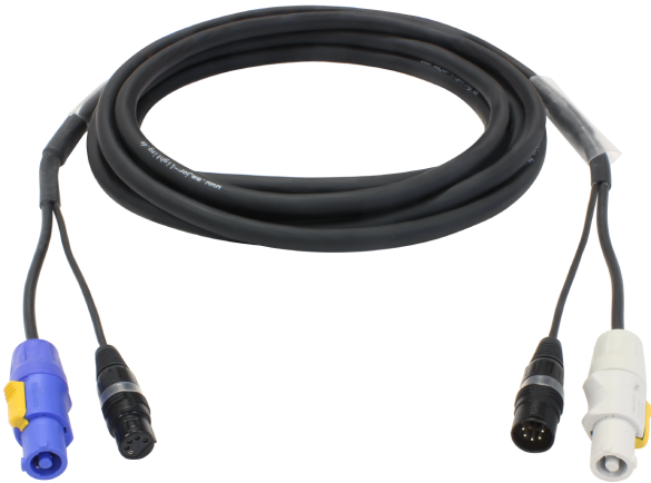
Beispielabbildung (mit XLR5 Stecker)